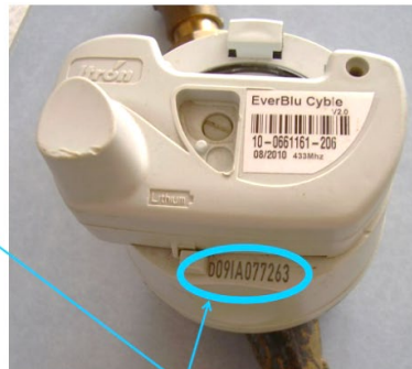
Numéro du compteur

Adresse de facturation (si différente de la propriété) :